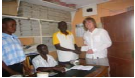
Übergabe der Schulgelder