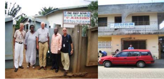
Kranken- u. Aidsstation