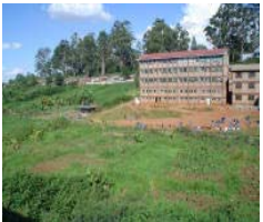
Kibagare Good News Centre