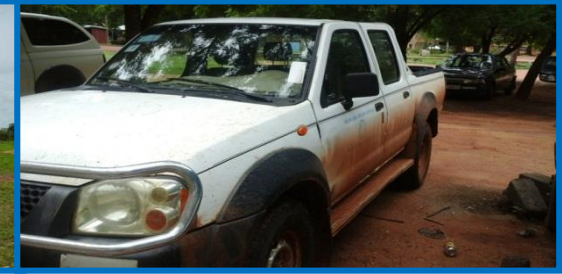
Waren und Menschen transportieren

Nach jüngsten Erhebungen gibt es mehr als 700 000 Witwen in Ghana. Ihre Lebensbedingungen sind äußerst schlecht. Ohne jegliche staatliche Unterstützung müssen sie selbst für ihren Lebensunterhalt und den ihrer Kinder sorgen. Dazu kommt noch die große Rechtlosigkeit der Witwen und die immer noch weit verbreitete häusliche Gewalt gegenüber Frauen. Das WOM hat sich zur Aufgabe gemacht, die Situation der betroffenen Frauen zu verbessern. Betty Ayagiba hat diese Selbsthilfegruppe 1993 ins Leben gerufen. Aus Altersgründen hat sie die Leitung jetzt an Fati Abigail Abdulai abgegeben. Seit 1997 unterstützt das Bürgerkomitee die Witwen immer wieder mit kleinen Geldbeträgen. So konnten u.a. Saatgut, landwirtschaftliches Gerät und Micro-Kredite als Anschubfinanzierung für eine kleine Selbständigkeit finanziert werden.