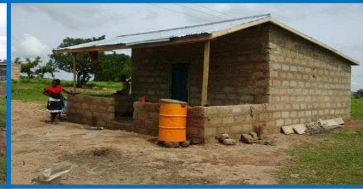
Landw. Produkte herstellen